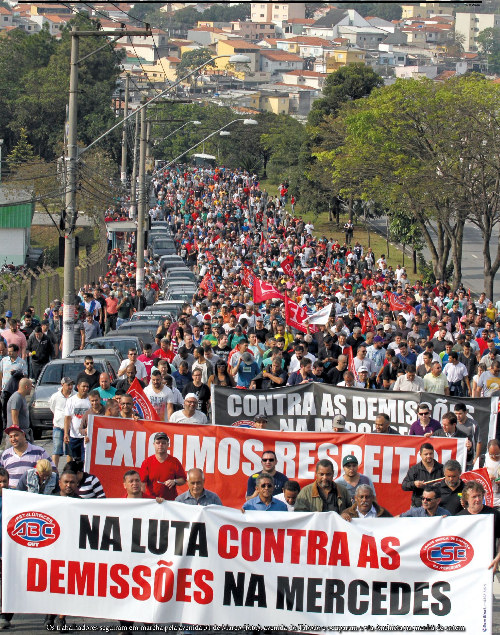
Os trabalhadores seguiram em marcha pela avenida 31 de Março (foto), avenida do Taboão e ocuparam a via Anchieta na manhã de ontem